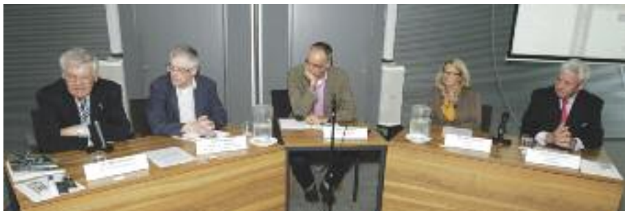
Het panel tijdens het symposium.

We zien steeds meer complexen met huur- én koopwoningen. Dat betekent dat je huurders en kopers in één gebouw krijgt. De Vereniging van Eigenaren neemt de besluiten en huurders spelen hierin nauwelijks een rol. De Nederlandse Woonbond wenst dat huurders in gemengde complexen meer te zeggen krijgen. Op 1 april was hierover een drukbezocht symposium in Utrecht. Respectus ging erheen om de mogelijkheden van zeggenschap te leren kennen.