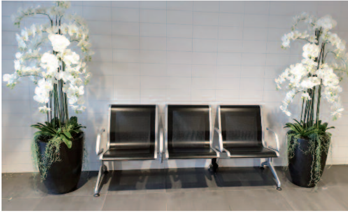
Mooie planten sieren de hal van de Paal van Kroon.

actieve bemiddeling als een huurder er buiten zijn schuld niet in slaagt om zelf een huurwoning te vinden. Daarnaast vindt Respectus dat als de huurders van de sloopwoningen hulpbehoevend zijn, zij extra ondersteuning moeten krijgen van WoonInvest in hulp of natura, om bijvoorbeeld Wmo-voorzieningen terug te plaatsen. We willen het sociaal plan elke twee jaar evalueren om zo vinger aan de pols te houden.'