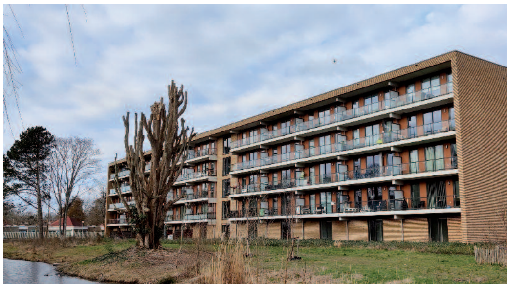
48 Nieuwe sociale woningen aan de Rijnlandlaan in Voorburg.

Die moeten ruimte bieden voor mensen op de wachtlijst en voor statushouders. Aan de Vlietweg 16/17 verblijven nu tijdelijk vluchtelingen uit Oekraïne.