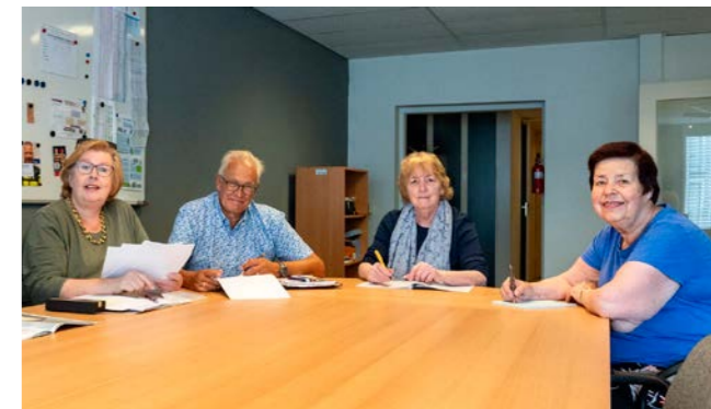
Het bestuur in overleg.