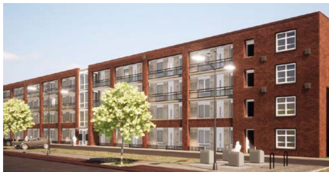
Nieuwbouw De Bres, moderne wooncomplexen aan de Nieuwstraat en Venestraat in Leidschendam.

weet Annelies. 'Er zijn stappen gezet, zoals een nieuw huurdersportaal en het Woonbelevingsonderzoek 2025.' Respectus ageerde tegen de 5,3 procent huurverhoging, die WoonInvest deels rechtvaardigde met verduurzaming. 'We hebben wel bereikt dat de inkomensafhankelijke huurverhoging in 2025 35 euro voor huishoudens met een hoger middeninkomen bedraagt en 70 euro voor huishoudens met een hoger inkomen, in plaats van de voorgestelde 50 en 100 euro. Een klein winstpuntje voor huurders.' De bestuursleden begrijpen evenwel dat corporaties ook moeten kunnen blijven investeren in onderhoud en nieuwbouw.