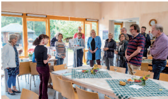
Duurzaamheidsbijeenkomst in de vernieuwde Stadstuin Rusthout.