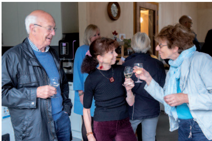
Klinken op het duurzame Activiteitenplan.

En de boodschap klinkt harder dan ooit tevoren. We zijn geen actiegroep. We willen ons doel bereiken samen met het gemeentebestuur, samen met de inwoners. We zien de wethouder op alle duurzaamheidsbijeenkomsten. Dat waarderen we zeer.'